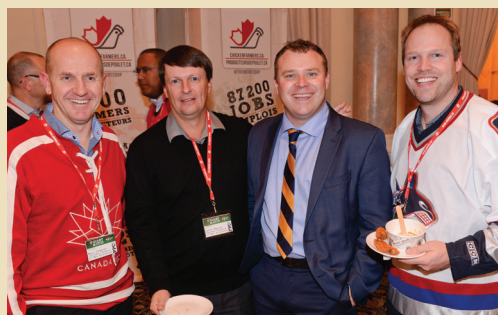
Les membres des Chicken Farmers of New Brunswick discutent avec le premier ministre du Nouveau-Brunswick, TJ Havey, lors de la fête d'avant-match des poulets 2.0.