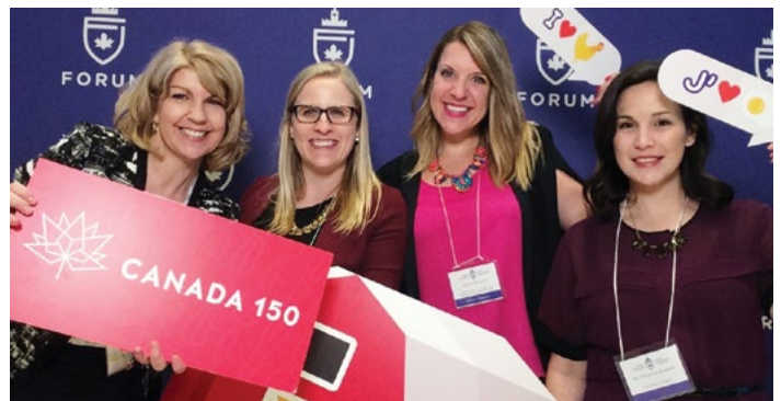
Des représentantes des Producteurs de poulet du Canada, des Producteurs d'œufs du Canada et du Forum pour jeunes Canadiens prennent la pose au kiosque d'égoportraits parrainé par les PPC et les POC lors de la réception des députés le 22 février.

À la lumière des faits nouveaux relatifs au commerce, le ministre de l'Agriculture a discuté de ses prochains voyages au Vietnam et en Inde et d'une possible renégociation de l'Accord